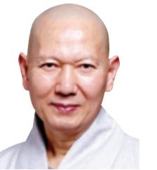
동국대 선학과 교수