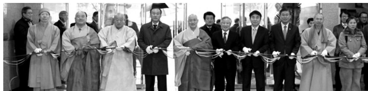
1월 16일 준공된 동국대 경주캠퍼스 커팅식. 신기숙사는 지상 9층 규모로 342명의 학생을 수용할 수 있다.