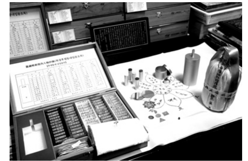
유상아트가 개발한 복장 장엄구 세트

www.yoosang.co.kr 노덕현 기자 noduc@hyunbul.com