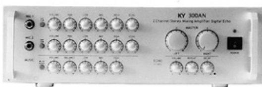
스테레오 앰프 300AN