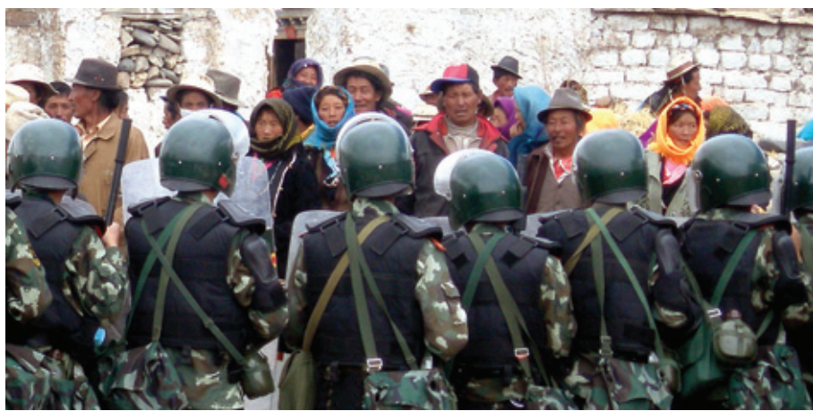
2010년 10월 티베트인들이 중국의 사상교육과 무력진압에 항의하다 중국군인들과 대치하고 있다.

26일 다수의 외신에 따르면 중국 티베트 자치구와 쓰촨성 사이에 있는 간쯔티베트 자치주에서 23일에 이어 24일에도 반중 시