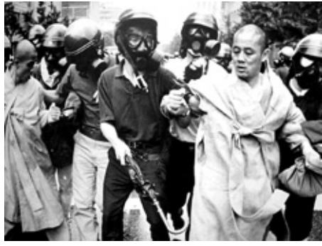
87년 조계사 집회에 참가하는 스님들을 연행하는 전경들