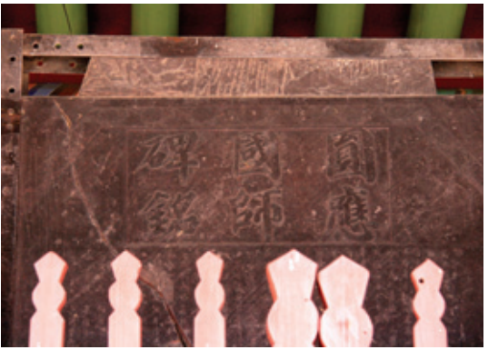
비구니사찰 중 큰 강원으로 유명한 운문사 원응국사 비명

원응국사비의 비문은 금강거사(金剛居士)라는 호를 썼던 문신 윤언이(尹彦顯 ?~1149)가 지었습니다. 글씨는 당시의 왕사였던 탄연 스님의 것으로 보고 있습니다. 비문의 내용은 27년 동안이나 임금의 곁에서 존경 받으며 법문을 설했던 원응 국사의 도력과 인품을 잘 전해주고 있습니다. 비석의 뒷면에