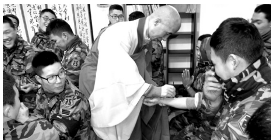
군장병들이 수계를 받고 있는 모습