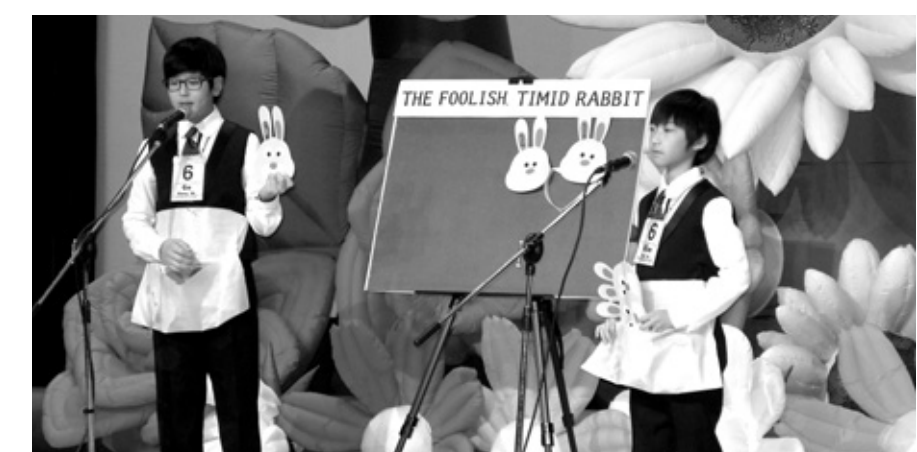
자타카 영어암송대회에 참가한 학생들이 경연을 펼치고 있다.

“Once upon a time a rich man gave a baby Elephant to a woman(옛날 옛적, 부자인 남자가 한 여자에게 새끼 코끼리를 주었습니다.)”