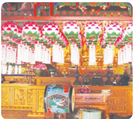
연등 자동 승강장치 _ 흥은사