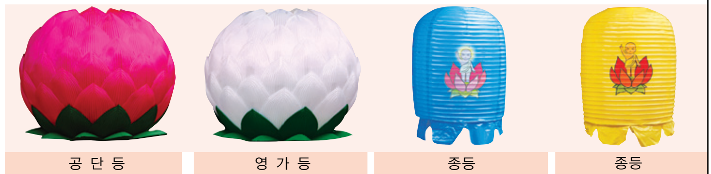
공 단 등