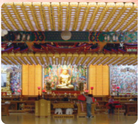
연등 자동 승강장치 _ 안산 월강사