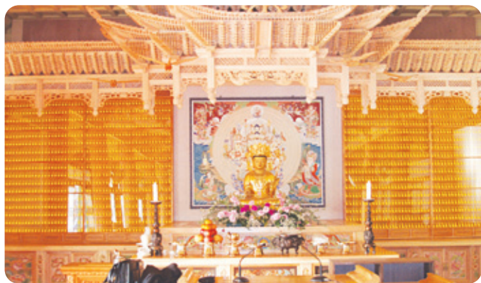
용주사 LED 인등