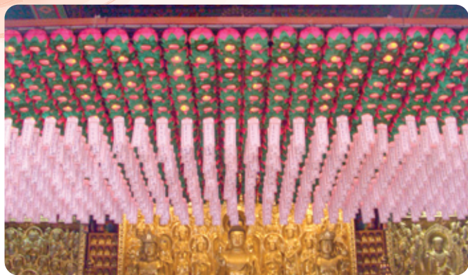
연등 자동 승강장치 _ 도선사