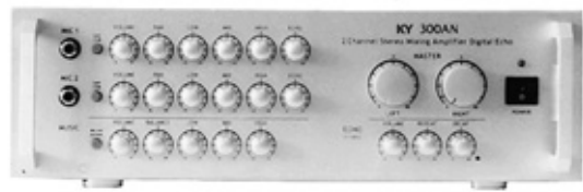
스테레오 앰프 300AN