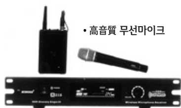
• 高音質 무선마이크

DX-707 스탠드 마이크는 1개만 사용해도 법당의 소리에 놀라운 기적이 일어납니다!!