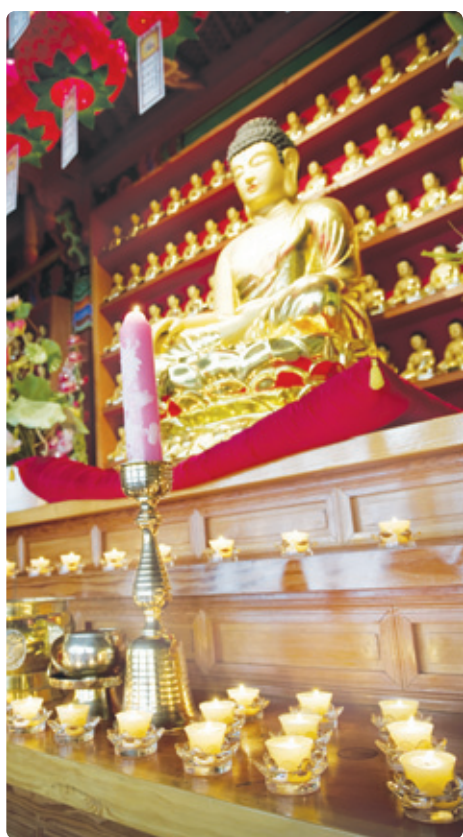
디자인 특허 : 제 30-2011-0010353 / 제 30-2011-0010355

삼환양초는 향료를 사용하지 않고 100% 자연향을 원료로하여 고객만족을 실현하고 있습니다.