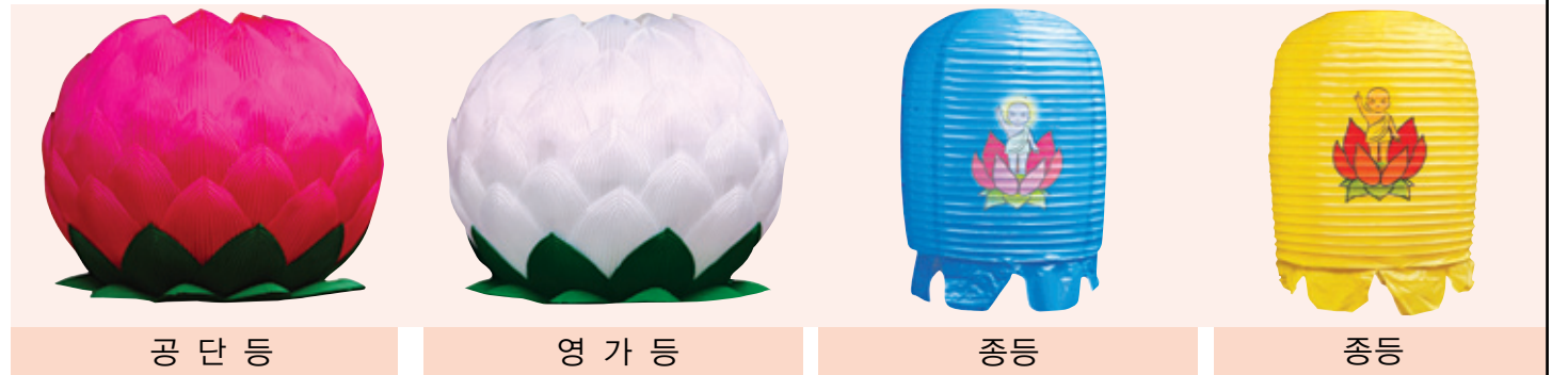
공 단 등