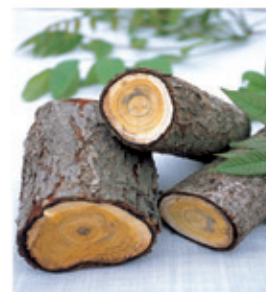
(국내산 토종 참옷나무)

우리 몸에 묻혀진 차가운 기운 즉 냉적은 각종질환 특히 여성질환을 유발하며 만성소화장애, 비만의 중요한 원인이 된다. 특히 복부비만과 하체비만, 여성의 생리통 냉대하 등의 경우 아랫배를 따뜻하게 하여 하체의 순환이 잘되도록 해야 한다.