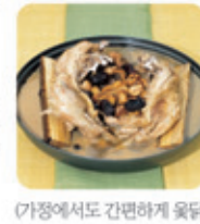
가장에서도 간편하게 웃닭

우리의 전통식품인 웃닭은 모든 세대에게 매우 유익한 식품입니다. 웃닭이 몸에 좋은 것은 누구나 알고 있으나, 웃옷을 현상을 두려워하여 기피하고 있습니다. 참옷의 원조 웃가네참옷진액은 FDA(미국에서도 안전성을 인증받은 제품)로 누구나 안심하고 드실 수 있는 웃이 타지 않는 참옷진액입니다. 웃닭은 이런분께 특히 좋습니다. 몸이 차고 추위를 많이 타는 분이나, 시궁창이나, 컨디션, 야외활동을 많이 하시는 분들이 드시면 몸을 따뜻하게 하여 감기질환 없는 건강한 겨울을 약속드립니다.