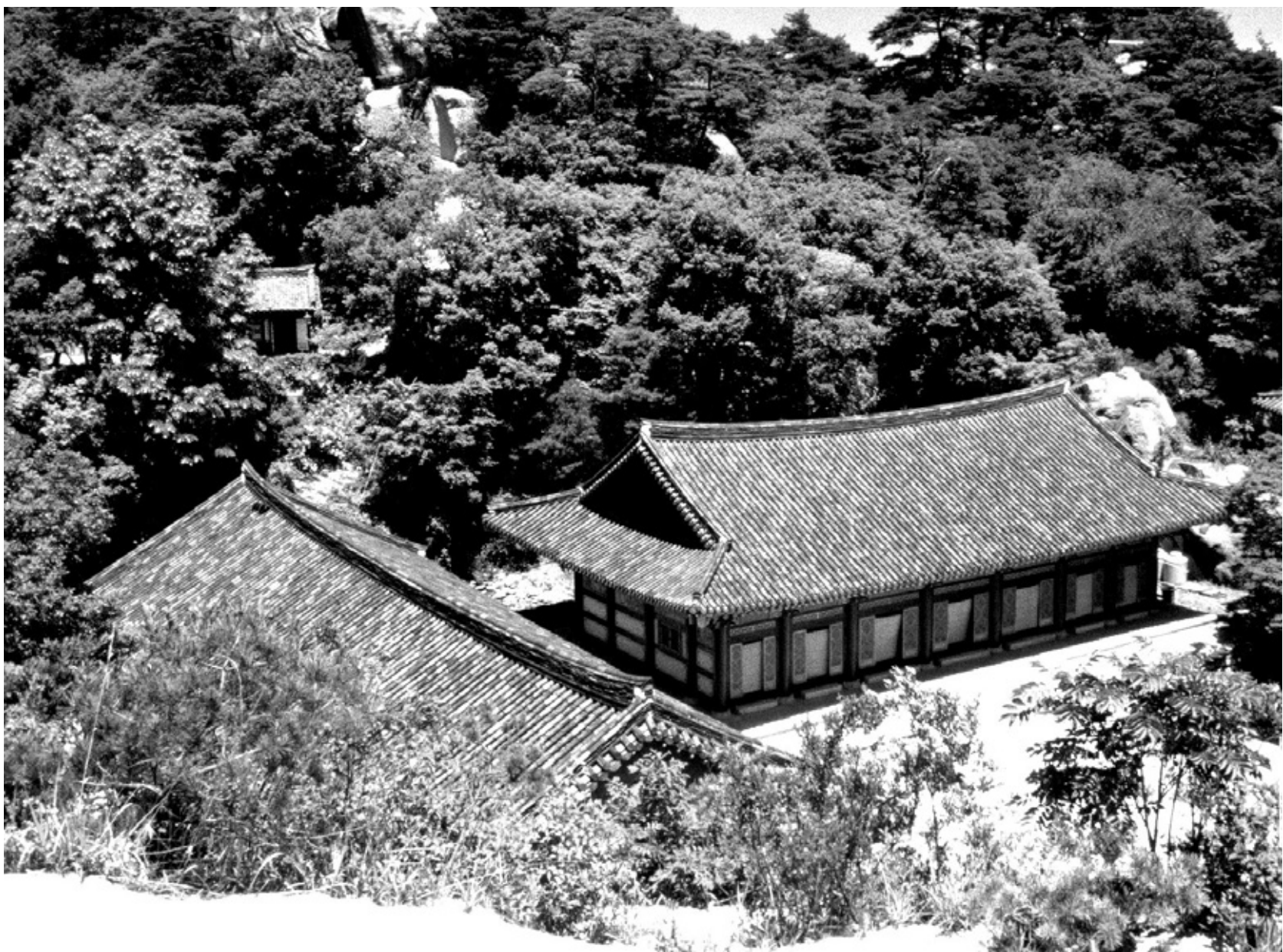
도봉산 망월사 전경. 망월사는 회룡사·불암사 등 인근 사찰과 함께 조선 후기 진언집이 간행되던 사찰이었다.

18세기 후반이나 19세기 초에 이르면 진언집은 주로 양주 망월사와 불암사에서 간행됐다. 망월사에