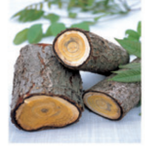
(국내산 토종 참옷나무)

우리 몸에 묻혀진 차가운 기운 즉 냉적은 각종질환 특히 여성질환을 유발하며 만성소화장애, 비만의 중요한 원인이 된다. 특히 복부비만과 하체비만, 여성의 생리통 냉대하 등의 경우 아랫배를 따뜻하게 하여 하체의 순환이 잘되도록 해야 한다.