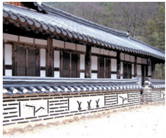
천은사 꽃담은 외편을 잘라 꽃을 만들어 넣었다.