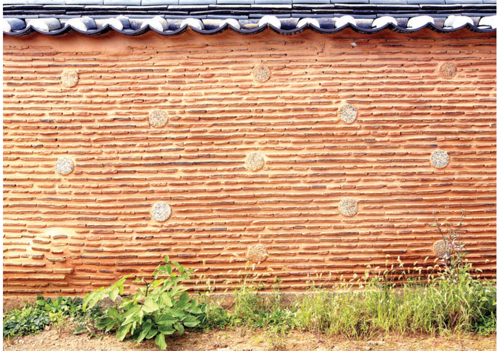
외편 담장 중 백미로 꼽히는 낙산사 담장

담장의 축조상세를 보면 층이 나게 평기와, 강회, 진흙을 차례로 쌓아 만들었고, 평기와를 6~7단 쌓은 다음 상하가 서로 엇갈리게 원형의 화장석을 박아 넣어 재료 및 형태에서 변화를 주었다. 이 담장은 각각 다른 재료들이 만들어내는 조화미가 탁월할 뿐만 아니라 멀리서 바라보면 담장에 박아 넣은 둥근 화장석이 마치 해와 달과 별처럼 빛나는 것처럼 보여 천지의 운행과 삼라만상이 이루는 오묘한 조화를 보는 듯하다.