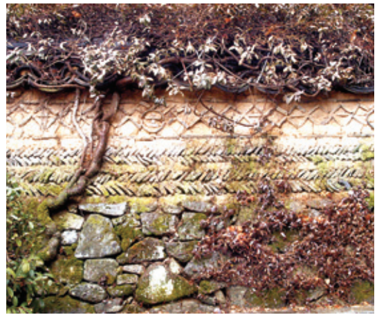
쌍계사 꽃담은 사찰 꽃담의 대표적 사례다.