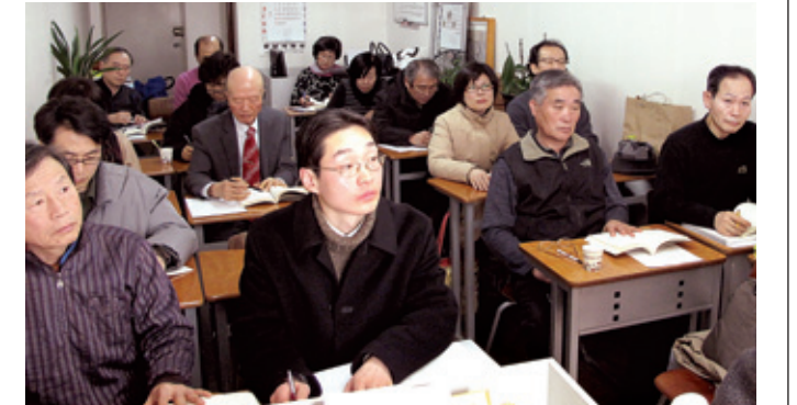
강의를 듣고 있는 본각선교원 수강생들