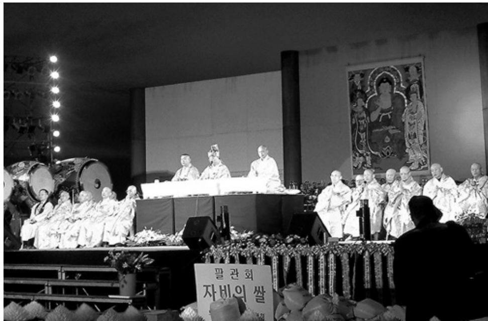
고려에서는 팔관회, 백고좌인왕도량, 금광명경도량 등 83종의 많은 호국의식과 행사가 존재했다. 사진은 2004년 부산에서 열린 국제민간단체 APECT 성공 개최를 위한 팔관회.

불교에는 침략을 정당화하는 정의의 전쟁이론이 없다고 본다. 불교에서 전쟁의 불가피성을 인정했다 해도 그것은 어디까지나 예외적인 상황이다. 또한 침략을 방어하기 위해 전쟁을 하는 경우에도 전쟁이 아닌 다른 방법을 강구하는데 최선을 다하고 전쟁 중에도 살생