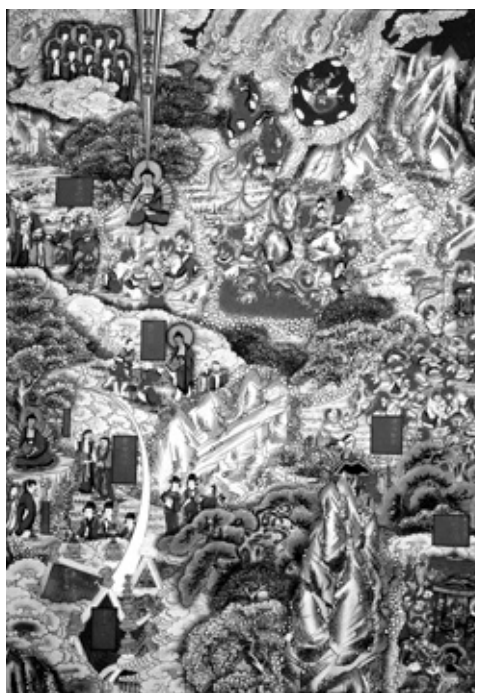
팔상성도, 수하향마상, 보리수 아래에서 마귀의 항복을 받는 상

고려 말에는 전선조병, 조총사격수, 화약제조병 등 전문적인 기술병은 승군이 독점했다. 승병이 정규군으로 호국의 선봉이 됐던 것이다. 조선에서 임진란으로 국가민족이 위기에 처했을 때 서산, 사명, 영구 등 대승들이 승병을 일으켜 스스로 무기를 들고 적을 무찌르는 데 앞장 서 큰 공을 이룬 것은 이러한 전통을