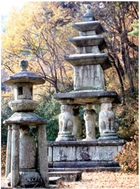
화엄사의 상징 사자사 삼층석탑과 석등

“시간? 아, 이 탑들이 삼국시대 때의 것이어서?” 지혜장의 의도는 그렇게 단순한 것이 아니었다. 이 높다란 석단위에 지어진 명부전 대웅전 영전 원통전 나한전 그리고 각황전과 석탑들이 창건 이후 긴 시간동안 생멸을 거듭하면서 각자의 위치를 지키