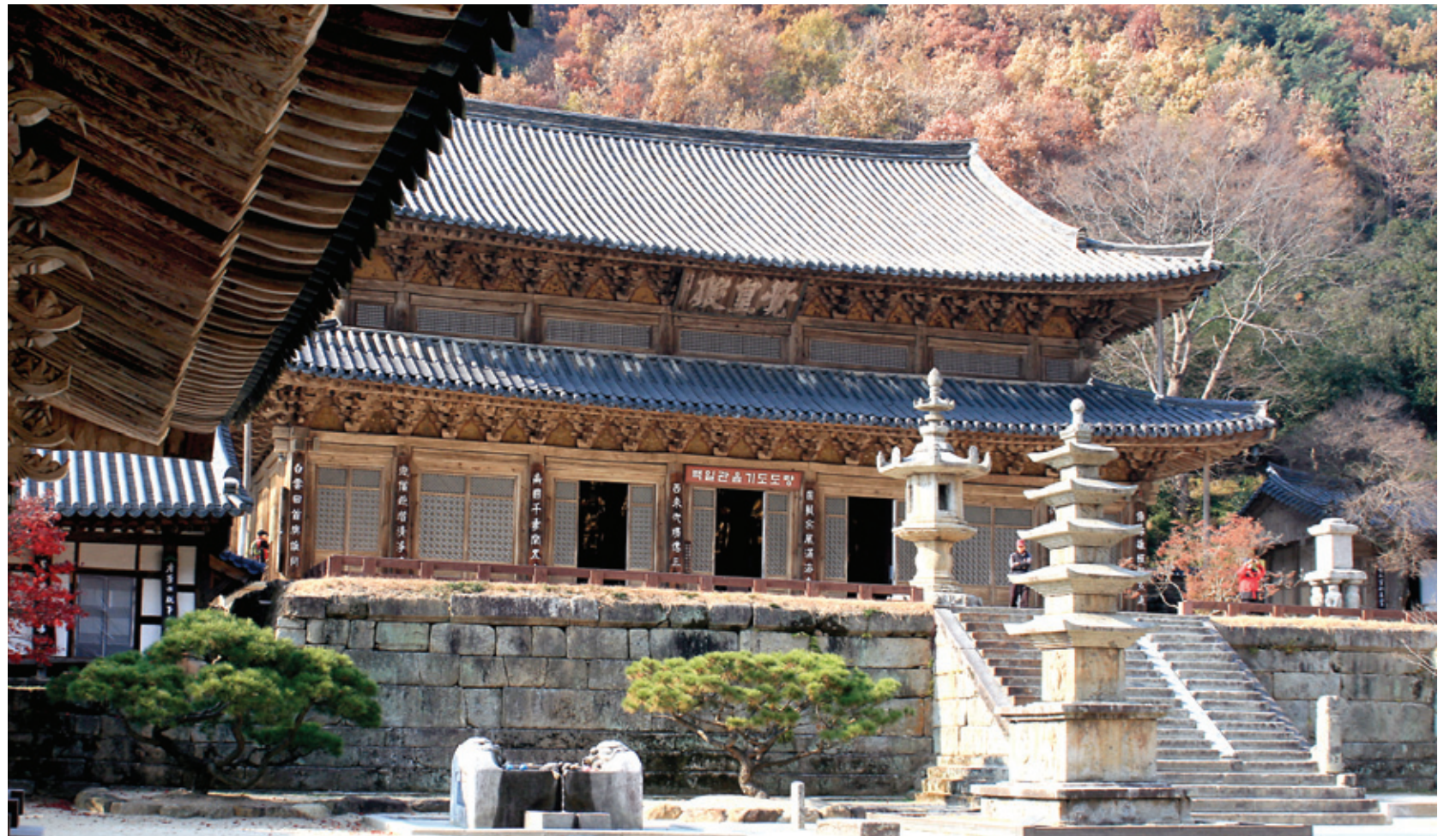
적목당 앞에서 바라본 각황전. 조선 숙종 때 지어졌으며 그 전에는 의상 스님의 장륙전이 있었다.

들이 참으로 대단했다고 생각해. 요즘처럼 장비가 좋은 것도 아니었을 그 시절에 손으로 이런 걸작을 만들었으니 말이야.”