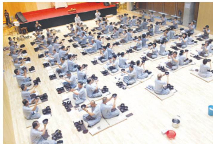
한국불교법사대학 제20기 법우들의 하계수련회 모습