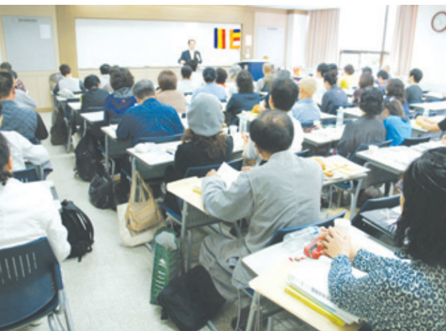
한국불교법사대학 학인들이 수업에 열중하고 있다.