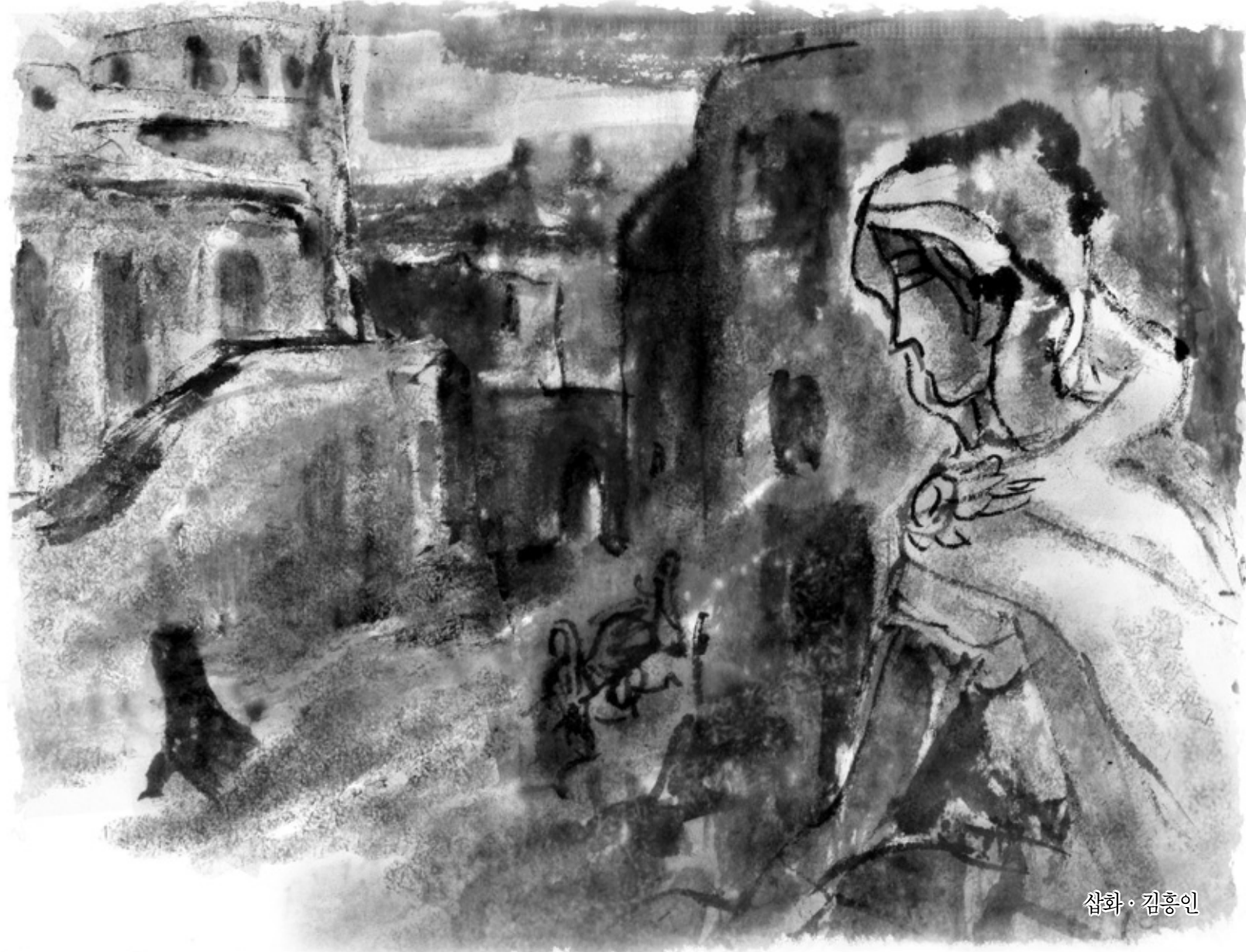
삽화 · 김홍인

둘이 다시 하나가 되는 것, 그것은 완성. 그 완성에서부터 이 우주 최초의 존재가 탄생한다. 그의 운명은 세계를 창조하는 것. 그는 맨 처음 신들을 탄생시킨다. 유지의 신 비슈누와 파괴의 신 쉬바가 바로 그들. 다음으로 식물과 동물들, 그리고 그 다음으로 인간을 탄생시킨다. 이윽고 세계의 거의 모든 것이 창조되었을 때 그 존재는 창조신의 또 다른 이름, 거룩한 브라흐마로 불리게 되고 수메르 산 정상, 인간은 달을 수 없는 그곳에서 유지의 신이 그에게서 창조의 힘을 앗아가는 순간을 파괴의 신이 그를 다시 본질과 형태로 갈라놓을 때를 맡음이 기다린다. 그는 이 세계 최초의 늙은이며, 정해진 운명을 알고 있는 유일한 신이다. 뭐야? 본질과 형태? 정해진 운명을 알고 있는 유일한 신? 너무 어려워. 무니의 말투에는 불평이 섞여있었다.