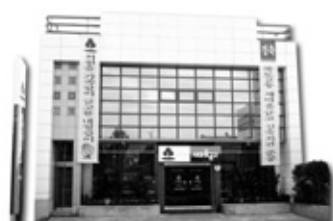
형산새마을금고 본점 전경