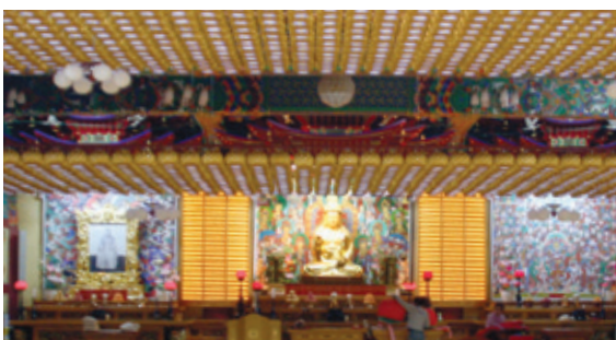
연등 자동 승강장치 _ 안산 월광사