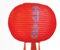
만 월 등