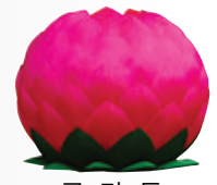
공 단 등