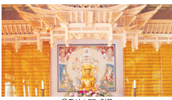
용주사 LED 인등