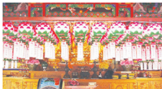
연등 자동 승강장치 _ 흥은사