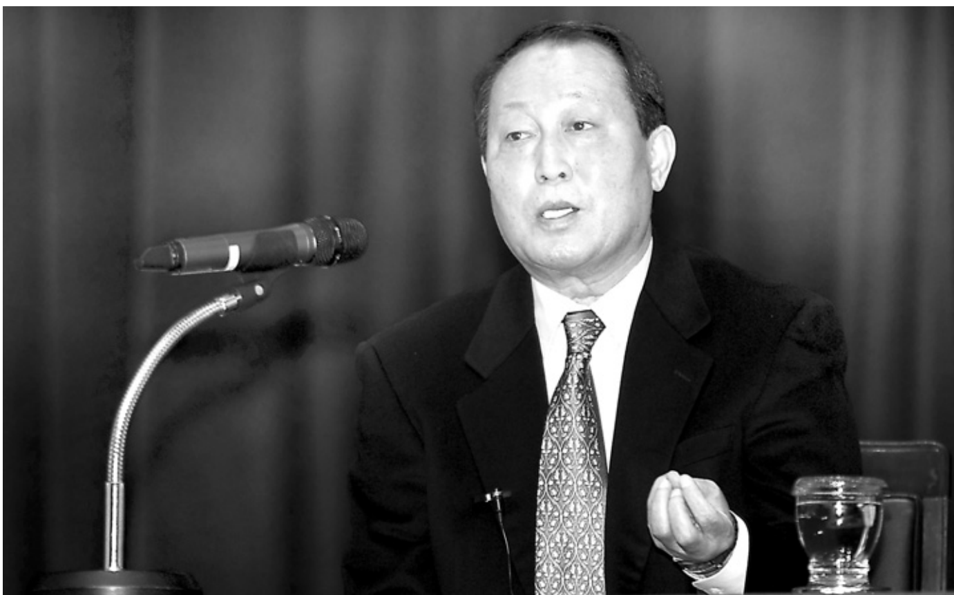
김인식 前 국가대표 야구감독은 12월 6일 동국대 중앙당에서 '믿음과 소통의 리더십'을 주제로 강연했다. 그는 "감독은 눈과 머리, 가슴으로 판단하되 배려가 전제되어야 한다"고 강조했다.

나는 그런 사정을 전혀 알지 못했습니다. 내 삶에만 빠져 주위를 돌아보지 못했던 것입니다. 그때 나는 또 한 번 결심했습니다. 다시 구단으로 복귀하게 되면 성적을 떠나, 오랫동안 동료들과 함께 일하겠다고 말입니다.