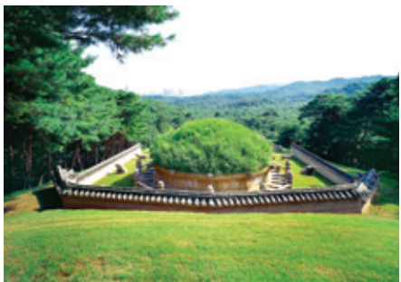
함흥역사로 덮힌 건원릉 봉분

방원은 억울했다. 비난을 감수하며 정몽주까지 죽였다. 정몽주의 핏자국이 지금도 선죽교에 선명하게 남아 있다. 공양왕을 폐위시킨 악역에 앞장섰지만 개국 공신 책록에도 제외당하는 굴욕을 감수했다. 아버