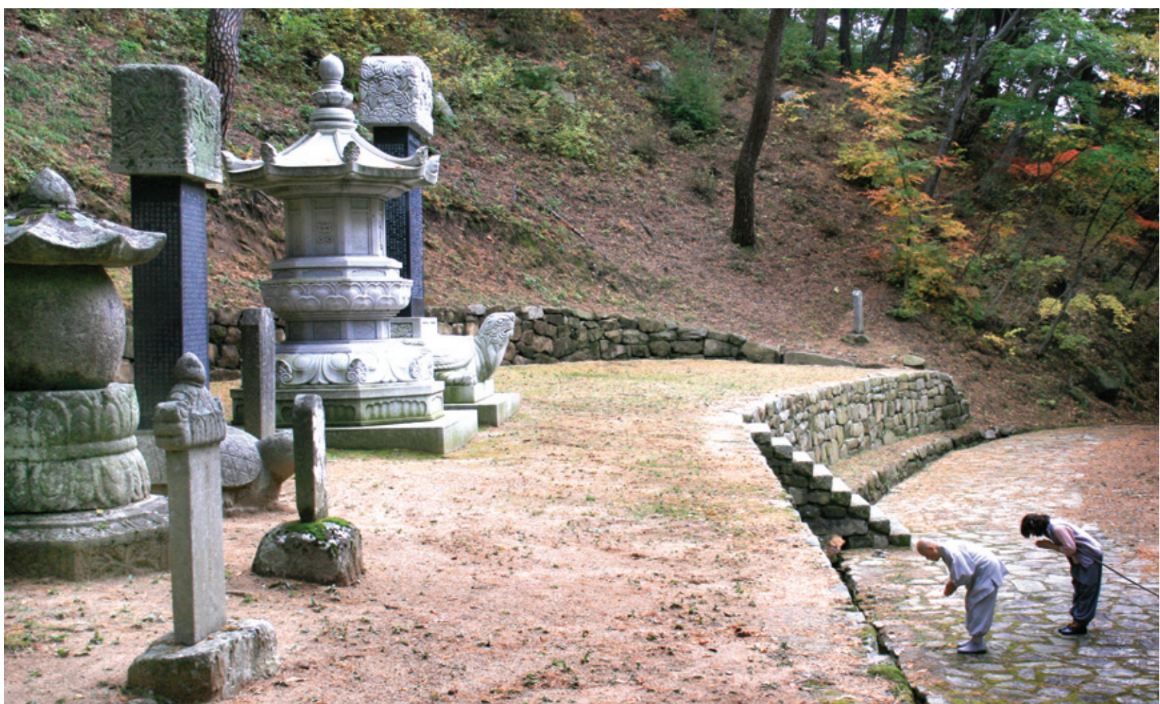
산책을 하다가 부도를 향해 예를 표하는 파계사 조실 도원 스님

스승의 인가는 곧 제자의 삶이어서 천년 고승의 가풍은 검소함과 고요함이었습니다. 받침돌에 푸른