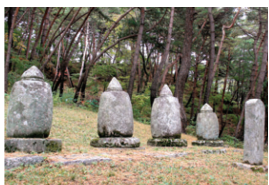
파계사 대비암 근처의 부도밭. 두 번째가 현응당 비