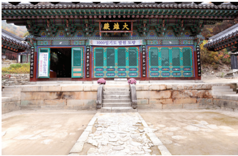
고려시대 왕찰이던 청평사 대웅전 마당