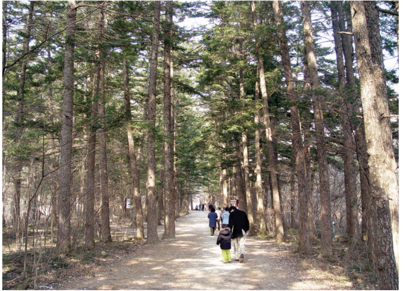
내소사로 가는 길, 나무가 우거진 숲 사이를 거닐다 보면 세상 근심을 모두 잊는다.

우리 전통사찰 안에 만들어진 길의 포장 가운데에는 특별한 경관성을 보이는 것들이 많다. 통도사 절길은 자연석을 모자이크 타일처럼 깔아 아름다움을 만들어냈다. 청평사 절길은 화강석으로 된 경계석을 놓고 그 안에 돌을 박석처럼 다듬어 깔았는데 왕궁의 어도와 같은 분위기가 난다. 청평사가 고려시대에 왕찰로서의 사격을 지니고 있었으니 포장에서도 그러한 상징성이 드