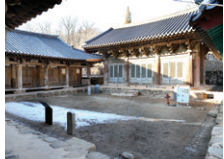
잘 정돈된 화암사 마당