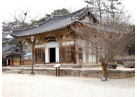
실상사 보광전 마당 모습. 흙마당이 정겹다.