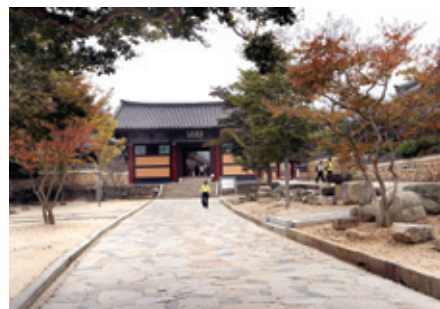
양산 통도사의 잘 정비된 돌길