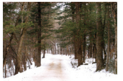
월정사의 전나무 길은 도로 포장을 걷고 옛길로 복원됐다.

러나도록 하였던 것으로 보인다. 한편, 부석사 경내의 길과 같이 흙길을 그대로 유지하고 있는 곳도 많이 있다.