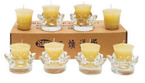
삼성화재 생산물 화재 배상 책임보험 1억원 가입

삼환양초에서는 법당에서 스님 및 여러 불자 님들이 부처님께 초 공양을 쉽게 올릴 수 있 도록 연꽃 모양의 크리스탈 받침대와 밀납양 초로 손쉽게 양초를 교체할 수 있는 신제품 을 개발하였습니다. 밀납양초는 특수 PC접을 이용하여 화재위험을 완벽하게 방지 하도록 설계되어 있어 법당 및 야외 어디서나 안전 하게 초 공양을 올릴 수 있습니다. 이제 모든 불자들의 마음을 담아 법당에서 1인1등 연 꽃밀납양초로 초 공양을 할 수 있습니다.