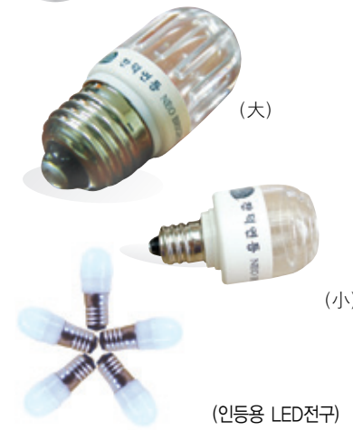
1년 365일, 하루 6시간 사용 전기요금: 98원/1kw