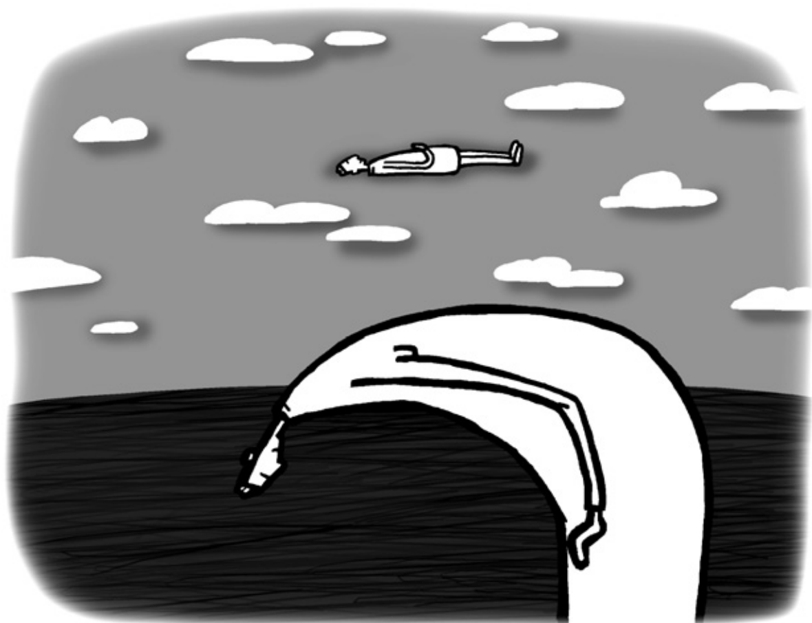
그림 · 최주현

그러나 부처님께서 가르치신 건 '큰 바다가 돼라. 일체를 다 삼키고 토해 내서, 큰 바다에 한 정수의 물로써 요만한 거 하나 버리지 말고 다 먹일 수 있게, 그 작용을 응무로써 해 바라. 그렇게 할 수만 있다면 정말 너는 이름해서 여러인 것이다.' 한 겁니다. 내가 요렇게 생각해서 얘기할게요. 집에 들어가서 애들이 "아빠!" 하고 부르면