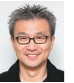
편집국 사진부 차장

온종일 가슴을 적셨다. 그리고 젖고 젖은 가슴이 끝내는 말을 했다. 보고 싶다고 비도 오지 않는 저녁. 나는 먼 빗소리에 젖어 퇴근을 했다. 어디선가 낙엽은 지고, 어디선가는 비가 내리고 있었다. 누가 알았을까. 멀리서 낙엽도 비를 맞고 있었다.