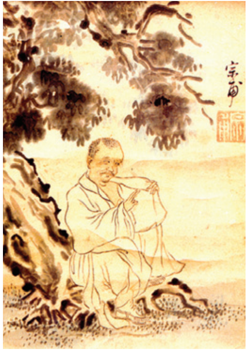
조영석의 '이 잡는 노승'

관아재 조영우(觀我齋 趙榮祐)는 현재 심사정(玄齋 沈師正), 겸재 정선(謙齋 鄭勳)과 함께 삼원삼재(三園三齋) 중 한 분으로 자(字)는 종보(宗甫)이고, 호(號)가 관아재(觀我齋)이다. 뛰어난 화재(畫材)를 지녔으나, 생전에 세조와 숙종의 초상을 그리라는 영조의 명을 "화원들과 무릎을 꿇고 앉아 그림을 그릴 수 없다"고 대쪽처럼 거절해서 곤경을 겪은 인물이다.