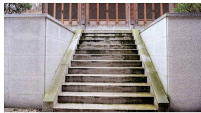
한 사찰의 화강석 계단의 줄눈이 보여 경관을 훼손하고 있다.