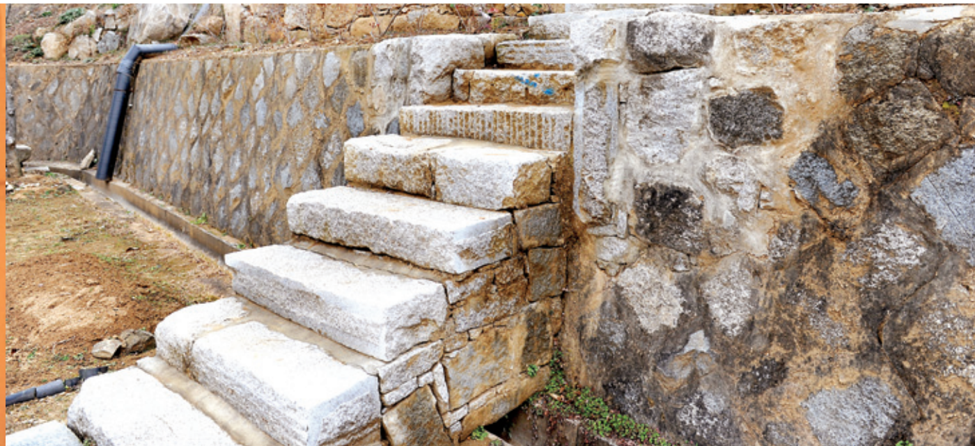
재료와 축조방식이 무질서하게 조합된 계단