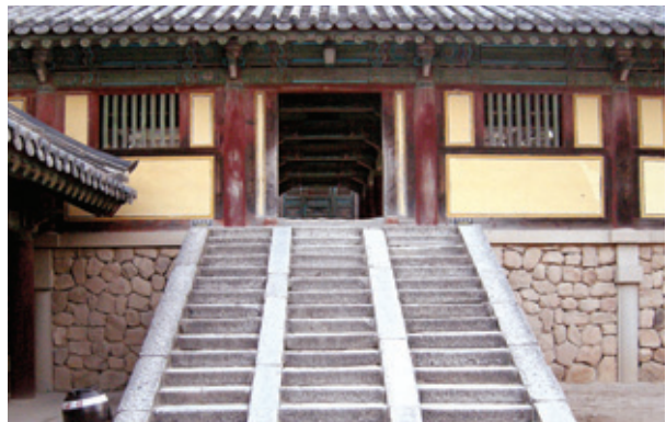
불국사 극락전에서 대웅전으로 올라가는 48계단