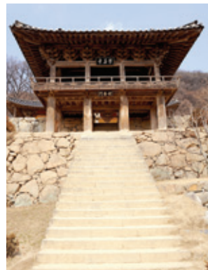
부석사 안양루 계단