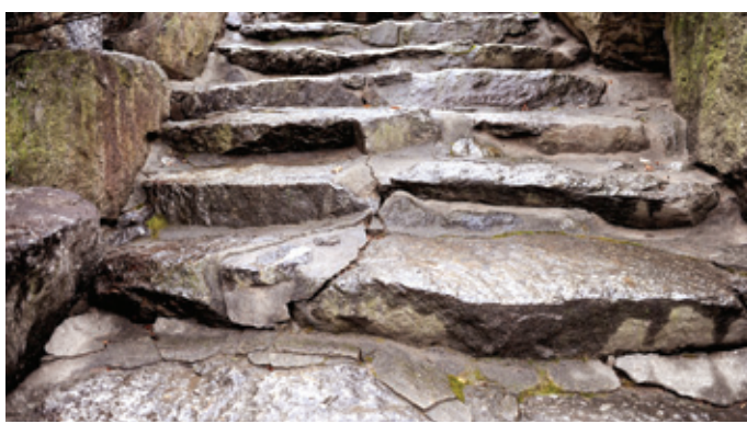
모르타르로 점함한 자연석 계단은 전통사찰의 이미지를 훼손한다.

우리나라 전통사찰에 만들어진 계단은 디자인적으로 우수한 것들이 많다. 그러나 그렇지 못한 것들도 보이는데, 그러한 좋지 않은 사례를 유형별로 살펴보면 양식·재료·기술상의 문제로 구분해 볼 수 있다. 양식상의 문제는 그 사찰의 경관성을 해치는 가장 큰 원인이 되는 것으로 과도한 디자인을 적용한 경우, 전통사찰 계단에서 볼 수 있는 디자인요소를 잘못 해석해 이상한 양식을 만들어낸 경우, 원래 있었던