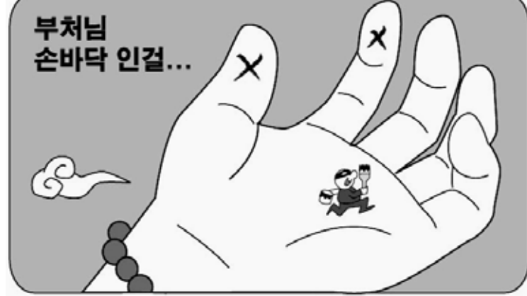
부처님 손바닥 인걸...

“오늘 밤 선사님과의 대화는 세계의 놀라운 다양성과 국경을 넘어 다리를 잇는 인류 공동의 휴머니티를 우리에게 다시금 환기시킵니다.”