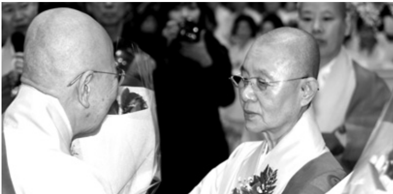
제10대 전국비구니회장 명우 스님(오른쪽)이 취임법회 후 대중들로부터 꽃다발과 함께 축하 인사를 받고 있다.

에서 물러나는 명성 스님은 “회장 경선에 투표한 1500여 비구니 스님들의 뜨거운 관심과 열기를 보며 비구니 승가의 밝은 미래를 느낄 수 있었다”며 “비록 이 자리는 떠나지만 한국불교의 새 역사를 쓰는 일에 남은 생을 다해 변함없이 노력하겠다”고 이임사를 했다.