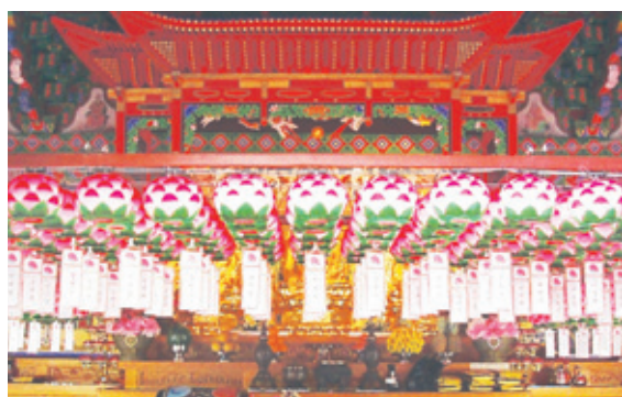
연등 자동 승강장치 - 흥은사