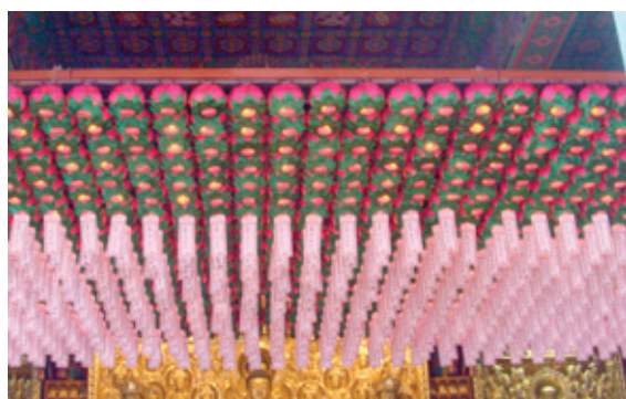
연등 자동 승강장치 - 도선사