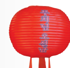
만 월 등