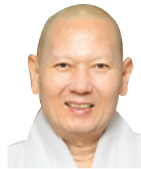
동국대 선학과 교수