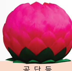
공 단 등