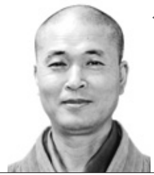
석우 스님의 주주록 선해