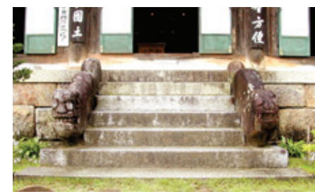
송광사 관음전 계단

(聖)의 공간인 화엄세계와 극락세계를 연결하는 상징성을 두드러지게 표현하기 위한 방법으로 여겨진다. 더욱이 청운교와 백운교 사이, 연화교와 칠보교 사이에는 홍예를 두어 다리의 이미지를 디자인적으로 해결한 것을 보면 신라시대의 장인들이 가졌던 디자인과 시공수준이 얼마나 대단했는지 미루어 짐작할 수 있다. 또 한 가지 재미있는 사실은 다보탑에도 석단에 조성한 계단과 같이 범수석을 두어 반복의 효과를 보이고 있다는 것이다. 그리고 연화교 디딤돌에 연꽃잎을 새겨놓은 것도 흥미롭다.