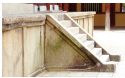
불국사 대웅전 계단