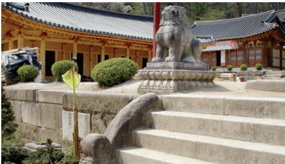
봉선사 석단에 연결된 계단

단, 송광사 관음전과 일주문 계단, 선암사 일주문 계단, 범주사 대웅전 계단 등이 대표적이다. 이들 계단은 소맷돌 디자인이 아름답기도 하고, 재미있기도 하며, 불교적 상징성을 잘 표현하고 있어 많은 사람들로 부터 사랑을 받고 있다.