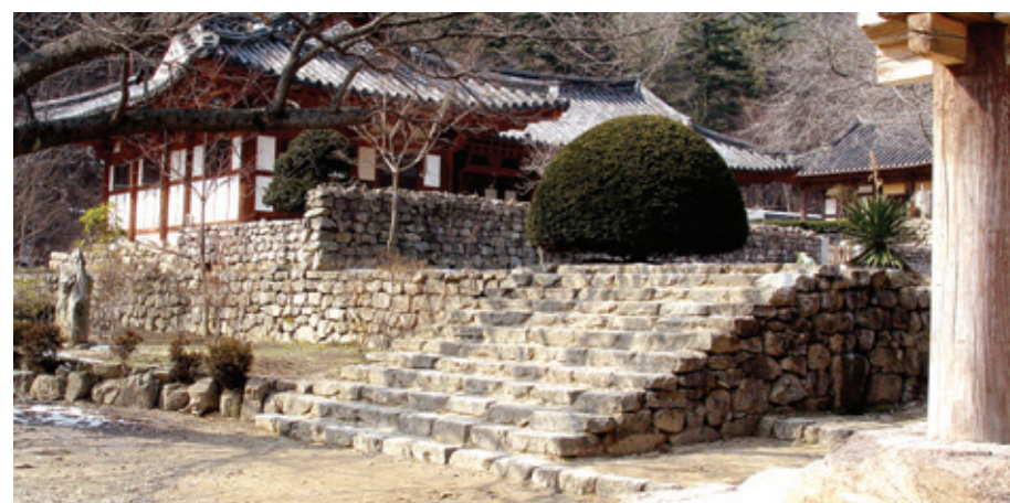
나소사 자연석 계단

화엄사의 경우에는 길게 다듬은 장대석을 사용해 계단을 축조했는데, 지대석을 몇 단 놓은 후 외장대를 설치하고 면석을 쌓아올렸다. 면석에 사용한 돌은 석단에 사용한 돌처럼 장대석을 크게 다듬은 것으로 석단과의 조화가 일품이며, 웅장한 이미지를 준다. 화엄사와 같이 높이가 높은 계단의 양측 마구리를 면석으로 마무리한 예는 많지 않기 때문에 이 계단은 디자인적으로 매우 중요한 사례가 아닐 수 없다. 봉선사와 같이 조선시대 왕실에서 조영한 사찰의 경우에는 석단과 마찬가지로 계단 역시 장대석을 잘 다듬어 디딤돌을 만들고 마구리에 소맷돌을 설치하여 완결된 형식성을 보