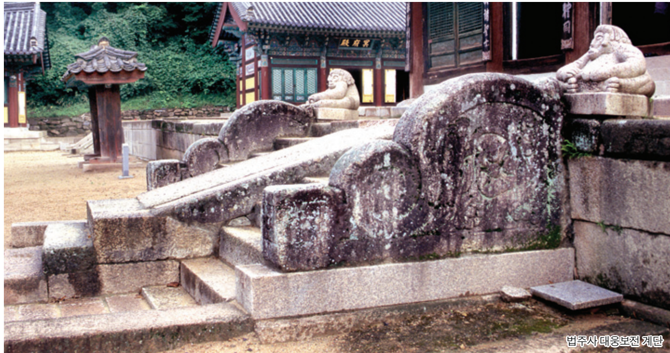
범주사 대웅보전 계단

한국의 전통사찰에는 높이가 다른 두 공간을 연결하기 위해 설치한 많은 계단들이 있으나 그 가운데에서도 불국사의 청운·백운교와 연화·칠보교는 특별하게 디자인된 계단의 백미라고 할 수 있다. 특히 청운·백운교와 연화·칠보교의 경우는 계단에 '교'라는 이름을 붙여 다리의 개념을 부여했다. 이것은 속의 공간으로부터 성