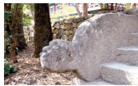
선암사 일주문 계단