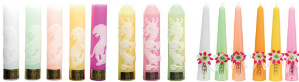
아랑 호랑이 양초 연봉 원기등 7.0 x 34cm

삼환양초에서는 법당에서 부처님께 초 공양을 쉽게 올릴 수 있도록 연꽃 모양의 크리스탈 받침대와 밑받초로 손쉽게 양초를 교체할 수 있는 신제품을 개발하였습니다. 밑받초는 특수 PC컵을 이용하여 화재위험을 완벽하게 방지 하도록 설계되어 있어 법당 및 야외 어디서나 안전하게 초 공양을 올릴 수 있습니다. 이제 모든 불자들의 마음을 담아 법당에서 1인 1등 연꽃밑받초로 초 공양을 할 수 있습니다.