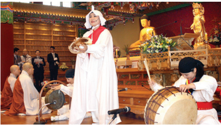
개원 1주년을 축하하는 축하공연