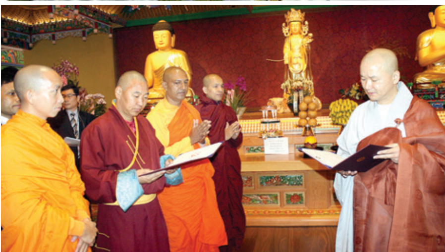
다문화 이웃과 교류와 지원을 약속하는 협약식체결