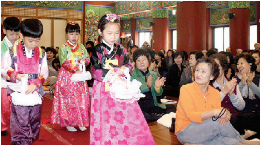
화동들의 입장 모습