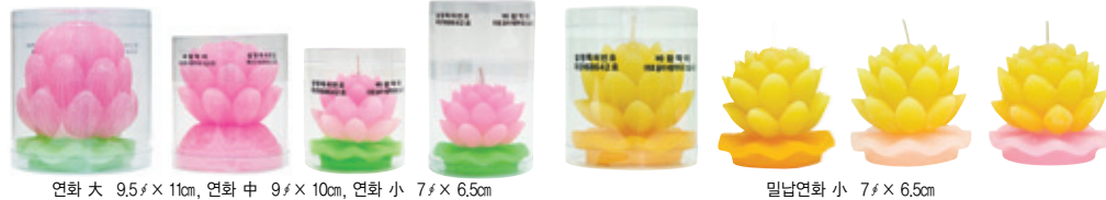
연화 대 9.5 x 11cm, 연화 중 9 x 10cm, 연화 소 7 x 6.5cm