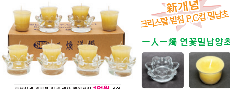
상선화제 생산물 화재 배상 책임보험 1억원 가입