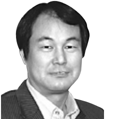
동국대 불교문화연구원 연구교수

무계과계(無戒破戒)의 말법 사상이 중세 신불교의 조상들을 탄생시켰다면, 에이존은 시대와 정면에 맞서서 오히려 대승정인에 바 탕한 계율부흥을 외친 것이다. 아마말로 불법 스스로의 정화력에 의한 것이 아닐까.