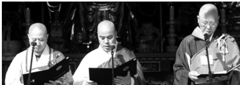
한중일 불교 대표자들이 세계평화기원 메시지와 세계평화를 위한 공동발원문을 낭독하고 있다.

로 출현시키고 인류의 평화와 화합은 더욱 요원해지고 있다"며 "현대 사회에서 우리가 더욱 주목하고 강조해야 할 것이 바로 불교가 이 사회에 전하는 사회적 가치이다"라고 말했다. 스님은 "혼자 누리기보다 함께 나누는 미덕, 폭력으로는 아무것도 해결할 수 없다는 것, 세상의 어떤 재화도 생명보다 귀중한 것은 없다는 것, 선을 이기는 어떤 악도 없다는 것을 세상에 인식시켜야 한다"고 강조했다. 중국불교협회장 환인 스님은 세계평화기원 메시지에서 "개개인 모두는 무연대비(無緣大悲), 동체대비(同體大悲)의 정신을 이어 받아 인류의 복지, 사회조화, 세계평화에 관심을 가져야 한다. 한중일 삼국 불교대표단은 공동발원문을 통해 세계평화와 인류의 행복을 위한 실천을 다짐했다. 종단협 부회장 직무대행 무원 스님(천태종 총무원장 직무대행), 중국불교협회 부회장 명성 스님, 일중한국제불교우호회의의 상임이사 모찌와 니치우 스님은 공동발원문에서 "뜻생명이 조화를 이루는 세상, 차별 없는 평등 세상, 전쟁 등 폭력 없는 평화 세상, 서로 양보하는 도덕적인 세상, 대화와 협력을 통한 지혜로운 세상, 모든 고뇌가 사라진 불국토를 만들기 위해 삼국 불자들이 한 마음 한뜻으로 정진하겠다"고 다짐했다. 글=조동섭 기자 cetana@gmail.com