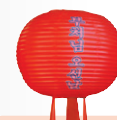
만 월 등