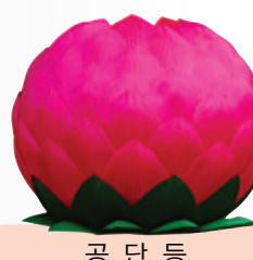
공 단 등