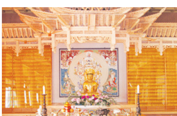
용주사 LED 인등