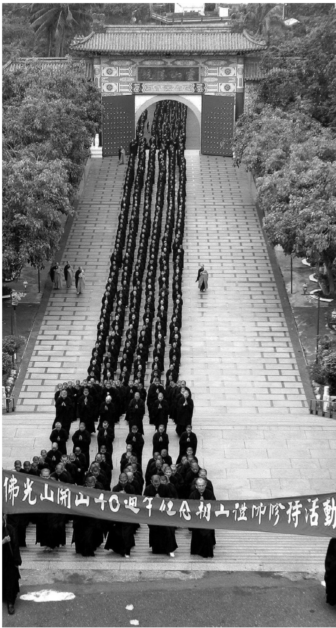
불광산 개산 40주년 기념 조산에불 수지활동. 개산 초심을 다지기위한 삼보일배가 진행됐다.