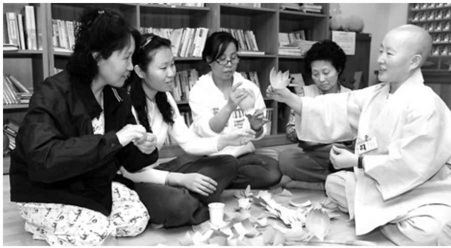
병원 법당을 찾은 환자들이 부처님께 올릴 연등을 만드는 모습

내가 가지고 있던 ‘정정’과 ‘정사’에 대한 나의 분별이 어쩌면 또 다른 차별을 만들고 있었는지도 모르겠다. 마음을 다해서 부처님을 부르고자 하는 사람들의 그 마음을 내 멋대로 재단했다는 부끄러움은 사실 감당하기 힘들 정도였다. 온몸과 마음으로 부처님을 찾았을 때 최선을 다하며 ‘예의’를