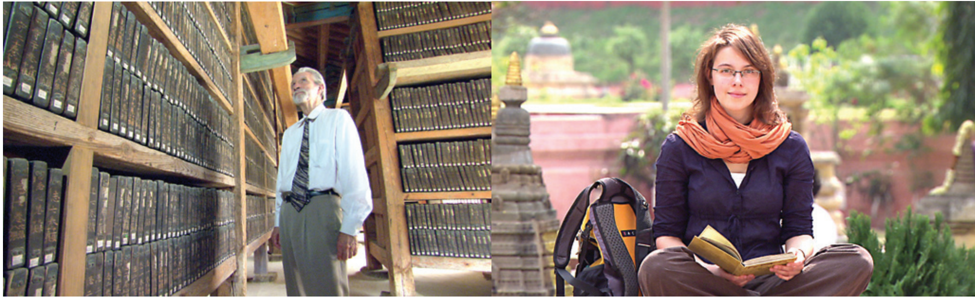
KBS 1TV 특집 4부작 다큐멘터리 '다르마'의 1편 '붓다의 유언'에서의 장면들