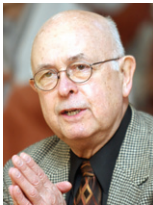
폴 니터 美 유니온신학대 교수

그는 불교가 자신을 더 좋은 그리스도인이자 신학자로 만들었다는 점을 분명히 강조하고 있다. 폴 니터 교수는 이 책에서 “하루 일과가 끝나면 나는 예수에게로 귀가한다”고 말하고 있다. 그의 말처럼 <붓다없이 나는 그리스도인일 수 없었다>는 그리스도교적인 물음에 대한 불교의 해답을 제공하는 것이 아니다. 그리스도인들이 그들의 복잡한 문제에 대한 그리스도교의 새로운 해답을 찾을 수 있도록 불교가 어떤 도움을 줄 수 있는지 제시하는 것이다. 폴 니터 교수는 이를 서양의 종교학과 신학계에서 치열하게 논의되고 있는 ‘여러 종교 전통에 속하기’로 보고 있다.