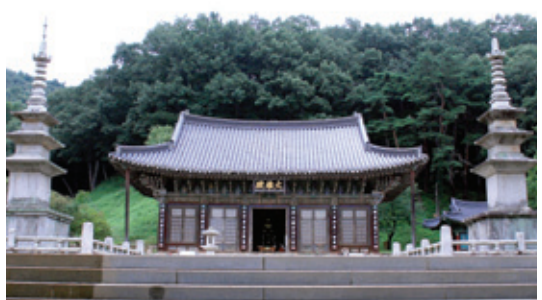
감천 직지사 대웅전 모습

“본사(本寺)의 초창(草創)은 신라 눌지왕(訥祗王) 2년(418) 아도 화상(阿道和尚)에 의하여 도리사(桃李寺)와 함께 개창(開創)됐다. 그 사명(寺名)을 직지(直指)라 함은 직지인심견성성불(直指人心見性成佛)이라는 선종(禪宗)의 가르침에서 유래했다고 하며, 또 일설에는 창건주(創建主) 아도 화상이 일선군(一善郡, 善山) 냉산(冷山)에 도리사를 건립하고 멀리 감천의 황악산을 가리키면서 '저 산 아래도 절을 지을 길상지(吉祥之地)가 있다'고 했으므로 직지사(直指寺)라 이름했다는 전설(傳說)도 있다. 또는