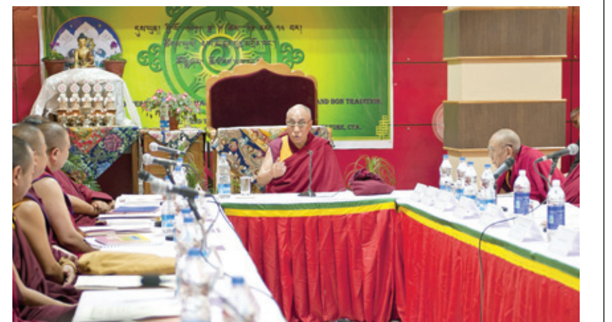
14대 달라이라마는 티베트불교 지도자회의에서 차기 달라이라마 선정을 위한 범령단을 조직하기로 했다.