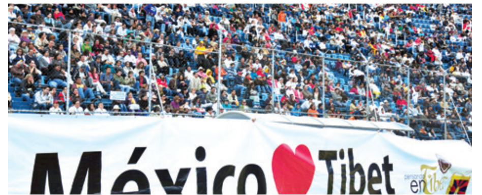
이날 법회에는 4만여 멕시코인이 참석해 티베트 독립을 지지했다.