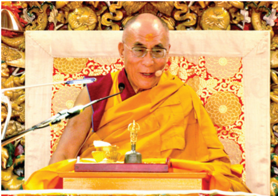
달라이라마가 다람살라 대종을 위한 법회를 열고 있는 모습

우리가 인식을 할 때 그 대상과 그 전의 의식인 등무관연이 연결의 고리를 만들어