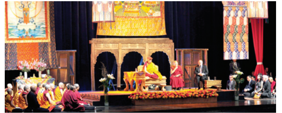
멕시코 시티 메트로폴리탄 극장에 마련된 법석

어느 곳에서 누구를 만나건 나는 언제나 행복합니다. 새로운 친구를 만나는 일입니다. 모든 인간은 생물학적으로 정신적으로 동일합니다. 100% 동일한 것은 육망한 행복을 추구하고자 하는 바람입니다. 비록 민족과 얼굴의 생김새 그리고 문화의 차이가 있을 뿐 절대 차별의 근거가 될 수 없습니다. 인간은 그 존재 형태 자체로서 모두 평등합니다.