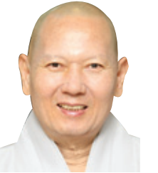
동국대 선학과 교수