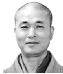
석우 스님의 주주록 선행

학승이 물었다. “무엇이 조사가 서쪽에서 온 뜻입니까?” 주주 스님이 말했다. “동쪽 벽에 표주박을 걸어놓은 지 얼마의 시간이 지났지?”