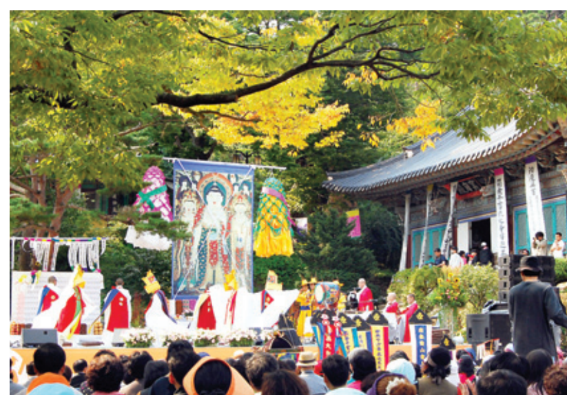
전등사 영산대제 시연 모습