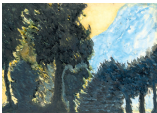
'풍경과 꽃' (중이에 유색 잉크, 1934년)

전문 미술교육을 받지 않았던 타고르는 동양미술, 원시미술과 현대미술 사조의 흐름을 접하고 화가로서의 자신을 발견했다. 타고르는 그림을 그릴 때 어떤 대상을 정하지 않고, 펜과 붓이 나오는 대로 그림을 완성했다. 많은 작품을 남겼지만 대부분