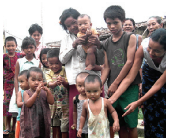
순수함을 간직한 인간존지 마을 주민들