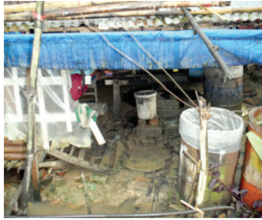
흘라잉따야 마을의 열악한 환경

미얀마문화원(원장 목탁)과 현대불교신문사는 미얀마 현실에 대한 지속적 관심과 지원의 필요성을 절감하고 2011년 3월부터 미얀마 붓다 지원 캠페인 '자비의 미얀마 돕기'를 진행하고 있다. 캠페인 일환으로 미얀마문화원 소속 붓다자비봉사단은 불자들의 성원과 후원금을 모아 미얀마 현지 극빈지역 마을에 우물을 비롯한 식수 개발을 실시하고 봉사활동을 진행했다. 미얀마문화원과 현대불교신문사는 앞으로도 미얀마 후원에 관심있는 불자와 봉사자들을 모집한다. 모금된 후원금은 미얀마 양곤에 건설 중인 종합기술대학 건립과 극빈지역 공동우물파기, 극빈지역 고아원 및 학교, 불우가정 지원, 미얀마 신병의식(재가출가식) 등에 사용된다. 특히 미얀마문화원 붓다자비봉사단 현지 방문으로 직접 후원물품을 전달할 수 있다. 노덕현 기자 noduc@naver.com 후원: 예금주)국제불교지도자협회 농협 301-0016-0537-01 (02)733-5670