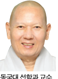
동국대 선학과 교수

한고추 - 고뇌에 찬 마음이 편안하게 맞을 내릴 수 있는 안식처를 제공해 줄 수 있는 - 가 되고 싶다. 한 발짝 내딛기 힘든 육신을 위해 예너지를 뽐뽐 주는 한고추가 되고 싶다. 왜냐하면 세상에선 자진 영혼도 많고 가누기 힘든 육신의 장애인도 많기 때문이다. 지체가 높을수록 위압감에 눌려 다가가기 어려운 사람도 많다. 많은 수행을 했다하여도 무슨 격식을 따지거나 좋아하고 낮은 곳에 손을 내밀 여유를 갖지 못하는 경우도 허다하다. 종교는 구원을 떠나서는 존재 의미가 희석될 뿐이다. 사람이 마시는 물도 물고기에게는 주저지가 되고 영가에게는 감로수가 된다. 물이 대상에 따라 각각각색으로 몸을 나뉜다. 한 모습만 고집한다면 이미 물의 속성을 스스로 잃고 말 것이다. 석존은 14무기(無記)에서 외도의 질문을 받는다. '세상은 영원한가, 아니면 무상한가.' 이에 영원하다고도 무상하다고도 답하지 않았다. 이 또한 명안종사의 노파견절한 표본이 아닐까. 세상에선 트레바리만 있는 것 같아도 어딘가에 한고추는 자비의 미소로 우리를 맞을 것이다.