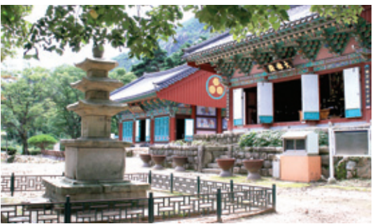
영동 영국사 배경

고려왕조 474년 역사에서 그 균형을 다스리기도 하고 거스르기도 하는 힘의 주축에는 불교도 포함되어 있었습니다. 태조 이래 불교에 대한 각종 특혜가 불교를 통치세력 내지는 통치의 조력세력으로 변질되게 했던 것입니다.