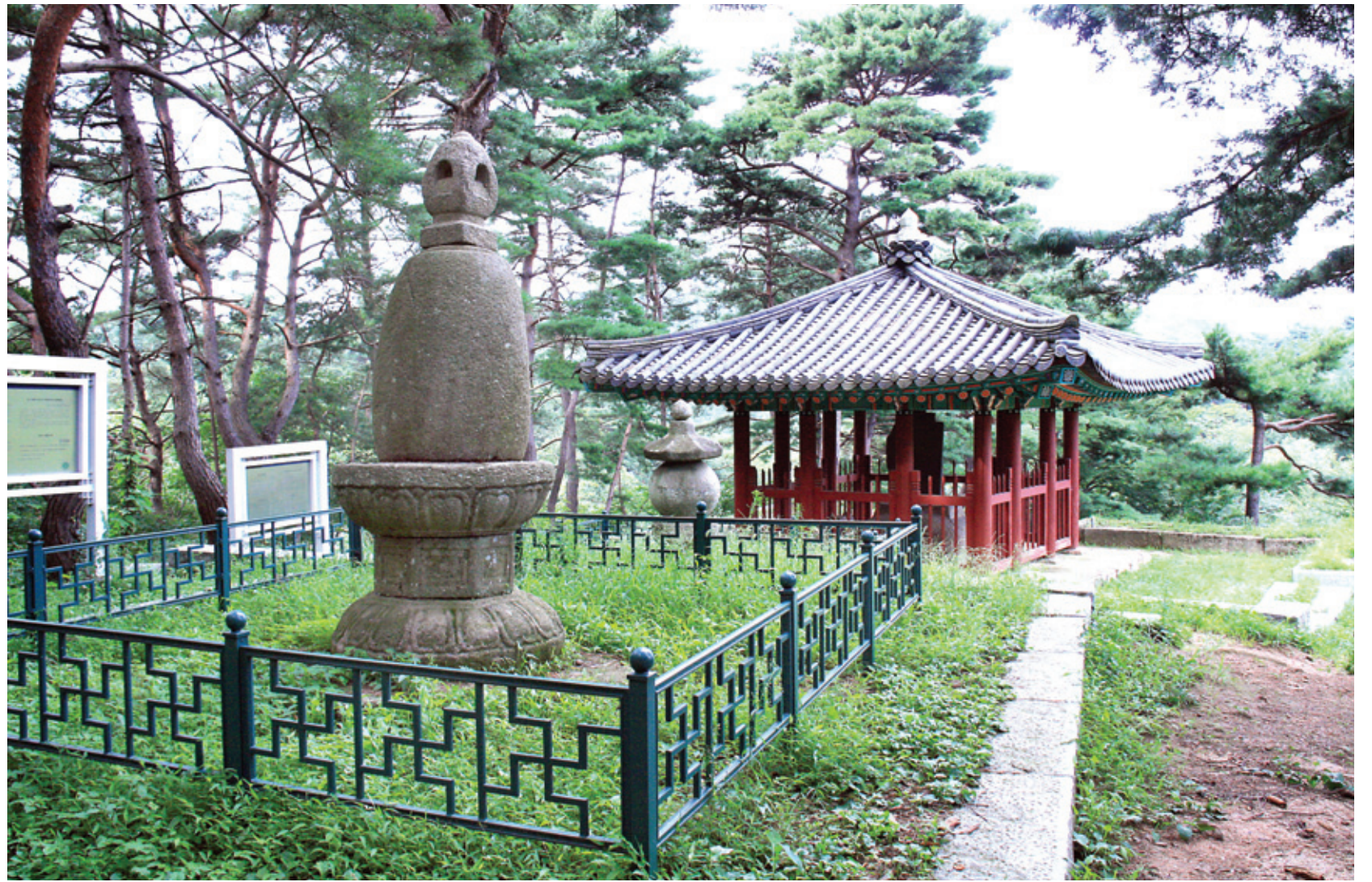
영국사 부도발 전경. 부도 뒤로 영국사 원각국사 탐비가 자리하고 있다. 원각국사는 이 탐비로 인해 가장 분명히 행적이 드러난 고승으로 꼽힌다.

비취진 불교계의 입지는 한 마디로 '타락상'입니다. 무능한 왕실이, 격변의 정치권이, 대륙에서 밀려드는 문물에 흥청대는 경제가 불교계를 타락시켰을까요? 그러한 혼란상을 바르게 이끌지 못한 불교계 역시 무능과 격변의 중심에 있었고 시류를 따라 흥청거렸던 것이라 할 수밖에 없습니다.