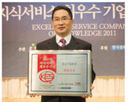
▲2011년 지식서비스 최우수기업 선정 사진

휘나햇은 30여종 광물질 (특허획득제 10-096707 호 발명의명칭:세라믹전기발열제 및 그 제조방법)특수제작한수퍼블랙드스크 B.C.P내장하여 450도로 가열할 때 발생하는 원외외선, 음이온, 온열이며 일반면상발열체와는 비교가 안되는 획기적인 기능을 갖는 휘나햇 반신욕기는특별할인된가격으로 한가정에 반드시 한 대씩보급될것입니다. (2020년까지)