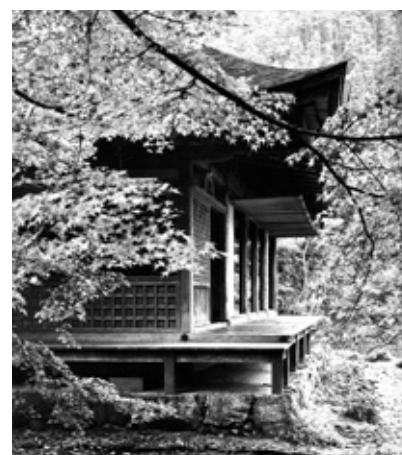
코잔지(高山寺) 세키스이인(石水院), 국보

밀교에도 깊이 심취한 그는 어느 날 강에서 말을 씻기고 있는 마부가 "아시 아시"하고 말에게 말을 걸고 있는 것을 들었다. 묘에는 이를 "아지아지"로 듣고, 그 말이 자신이 소중하게 여기는 아지(阿字; 일본어로는 아지라고 발음함)라고 생각해 "지금 당신이 아지 아지라고 한 것은 매우 고마운 말입니다. 그 말은 어느 분의 말입니까?"하고 물었다. 마부는 당시 궁중 경비를 맡은 관리의 직책인 부생(府生)님의 말이라고 밝혔다. 그러자 묘에는 "아, 이것은 아자본불생(阿字本不生; 府生와 不生의 발음이 후소로 같음)이 아닌가"하며 감탄했다. 그리고 그 자리에서 무릎을 꿇고 마부와 말에 손을 모아 합장하고 인사를 올렸다고 한다. 아자본불생이라는 말은 일체언어의 근원인 동시에 일체만유의 본원이라고 하는 밀교의 중요한 교의에 해당한다. 묘에가 얼마나 불도에 깊이 불타고 있었는지를 여실히 보여주는 일