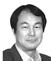
동국대 불교문화연구원 연구교수

사상적으로 불법의 회통과 종합성을 중시하는 구불교 교단에 속했던 묘에는 사회의 격변기에 이러한 정신에 바탕한 대승정신을 온 몸으로 체현하고 실천한 조사였다. 불법의 참된 의미가 시공을 넘어 이 시대에 더욱 빛을 발하고 있다.