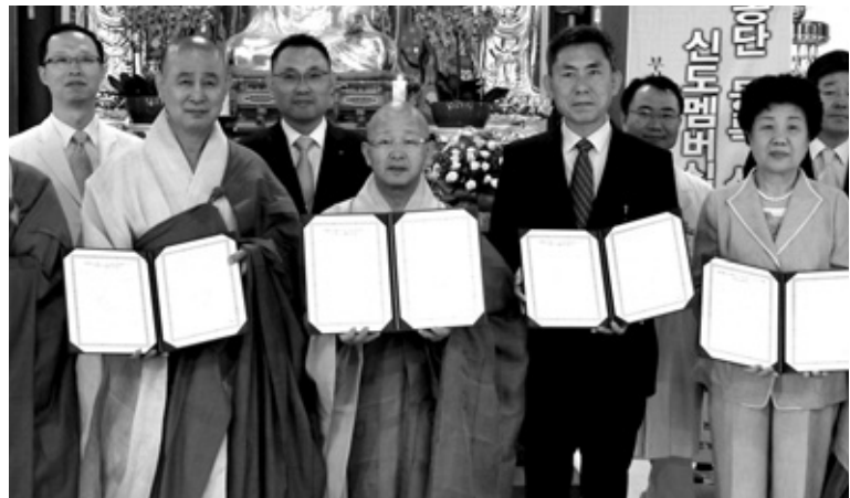
9월 3일 부산코모도호텔에서 '신도 멤버십 협약식'을 개최했다.

앞으로 조계종 신도증을 소지하고 매년 교무금을 납부하는 신도에 대해 코모도호텔 숙박 이용요금의 40%, 부산대 한방병원 진료비 10%의 할인혜택이 주어진다. 코모도호텔 부산은 주중과 주말